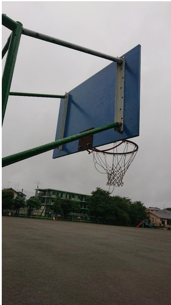
補足：コンパネ 24mm は施設課より支給