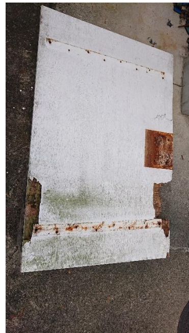
破損したバスケットゴール板↑→