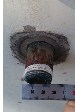
↑蛇口を取り外した状態の配管サイズ (3/4B 6分)