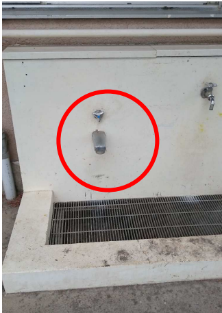
↑左蛇口を入れ替える

保健室の校庭側に水場があるが、飲料としても利用するが校庭での怪我などの水洗いにも使用する。その際、現状の蛇口ではうまく洗えないという問題があり水栓の1つをシャワータイプに置き換えたのでそれを記録する。