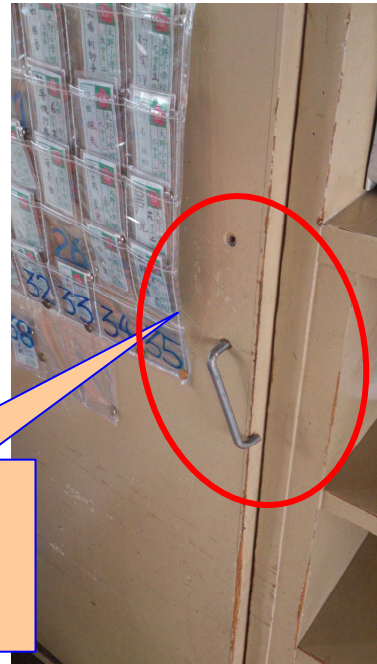
取っ手2 取り付けボルトが 外れている状態