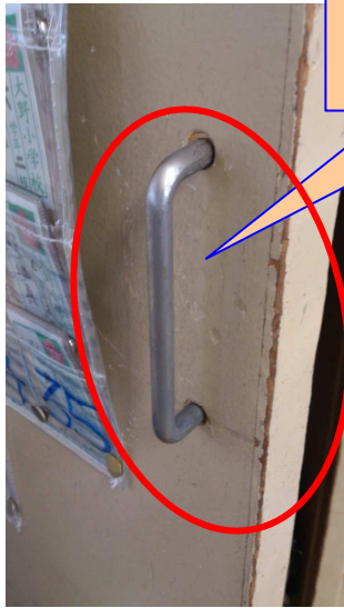
取っ手1 正常な取り付け状態

各教室および昇降口に掃除用具庫が設置されているが、その取っ手の不具合対応を記録する