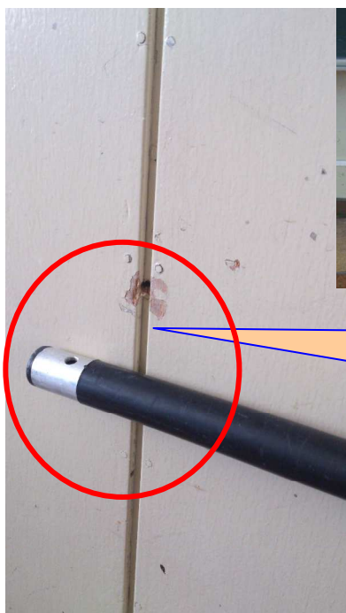
刺叉3 取付部分が欠落している状態

※ 下記のような不良がある場合には、 ※ L型ネジ金具（長さ 80mm）を用いて補修する事