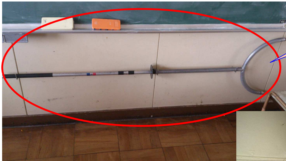
刺叉1 正常な取付状態

各教室のブロック毎に刺叉が安全上設置されているが、取付状態が不備な箇所などがある時には修理保全する。