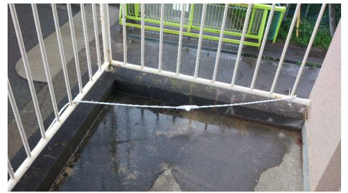
視聴覚室ベランダ部